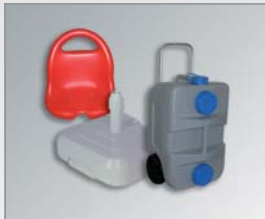
■ Kunststoffspritz- technik und Kunststoffblastechnik