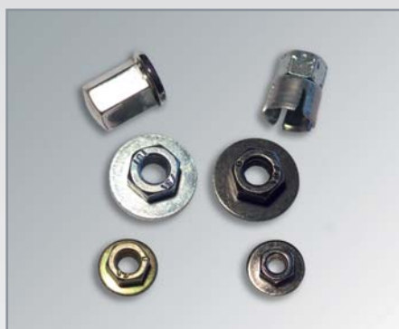
Sondermuttern als Comby-Teil