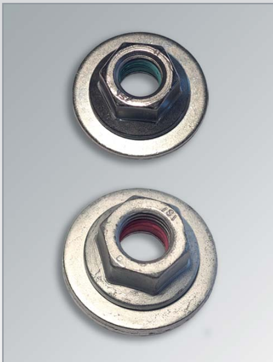
Kombimuttern mit Sicherungselement

Unsere Materialien/Systeme/Verfahren/Prozesse sind nach modernsten Systemen gesteuert und garantieren Ihre perfekte Mutter. Selbstverständlich sind wir zertifiziert nach ISO-TS 16949.