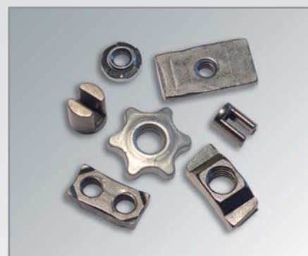
Spezialprofil- und Schweißmuttern