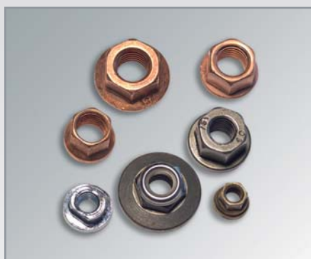
Spezialmuttern aus unterschiedlichem Werkstoff