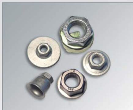
Muttern mit Hut oder Spezialcomby-Muttern