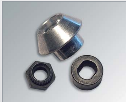
Muttern in Spezialform