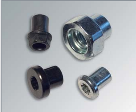
Antrieb der Muttern mal anders