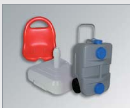
■ Kunststoffspritz- technik und Kunststoffblastechnik