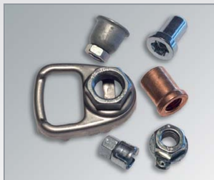
Sondermuttern für die Befestigung

Fordern Sie uns - wir helfen Ihnen bei Ihrem Erfolg!