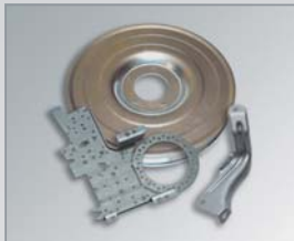
■ Blechbiege- und Stanzteile