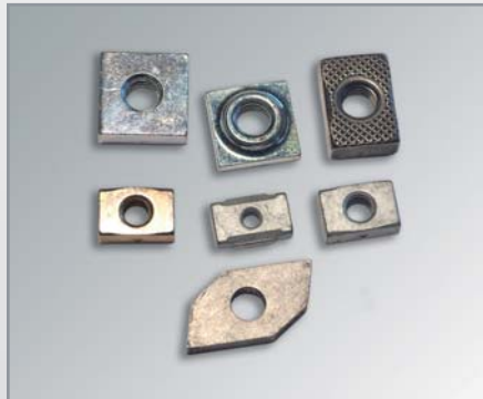
Profilmuttern / Rechteckmuttern