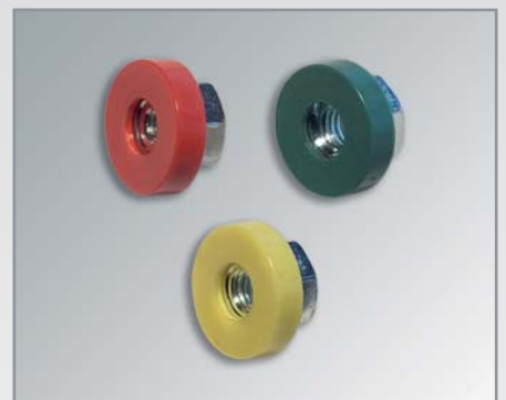
Muttern mit Kunststoffüberzug

Fragen Sie uns bei neuen Entwicklungen und fordern uns - zu Ihrem Vorteil!