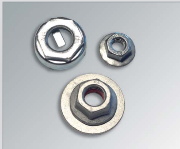
Gewindesicherungen / Muttern mit Befestigungspunkt