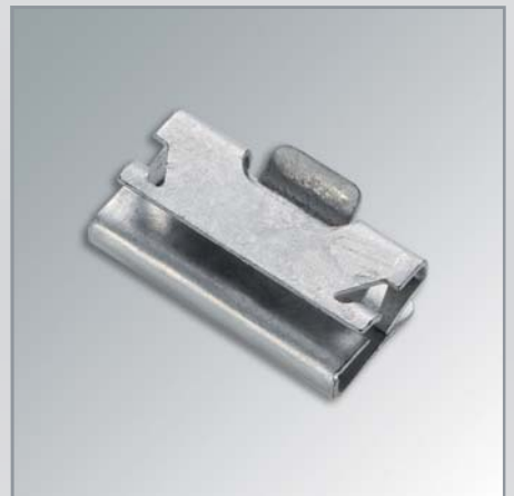
Halter für die Automobil-Industrie