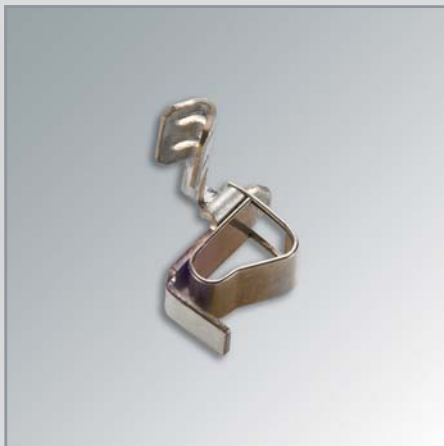
Kontaktteil Baugruppenfertigung (fertig fallend) von Bihler Maschine