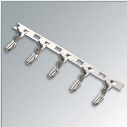
Steckkontakt als Spulenware