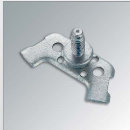
Baugruppe Stanzteil mit zugeführtem Gewindebolzen