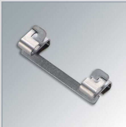
Edelstahl Clip zur Baugruppenmontage