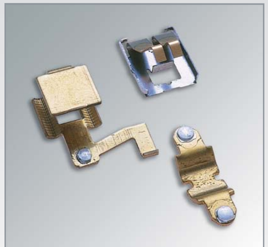
Diverse Stanzteile mit Silber-Schweisskontakt